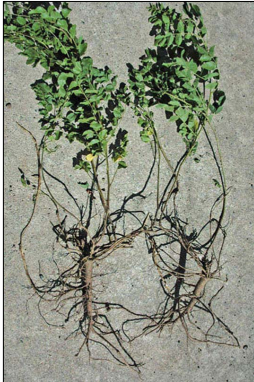
図1 カンゾウ植物を掘り起こしたもの