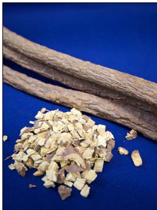
図2 生薬として用いられる甘草根ときざみ(甘草根をきざんだもの)