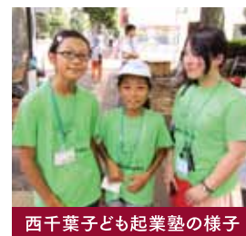
西千葉子ども起業塾の様子