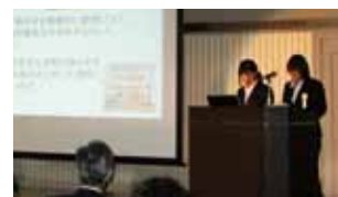
学生部門のプレゼン

グランプリ受賞者は、11月20日ベンチャー・カップCHIBAビジネスプラン発表会にて、プレゼンテーションを行っていただき、表彰を行いました。