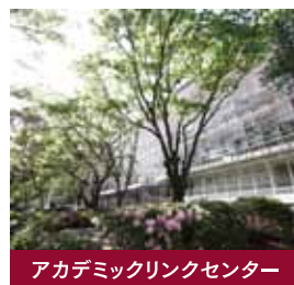
アカデミックリンクセンター

いるところですが、実は本学では、竹内附属図書館長のアイデアで全国でも珍しい新しいタイプの図書館に模様替えをし