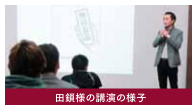
田鎖様の講演の様子

今後も千葉大学経済人倶楽部「絆」の会員の皆様にご覧いただけるようなセミナーをお願いさせていただきたく予定です。その際には宜しくお願いいたします。