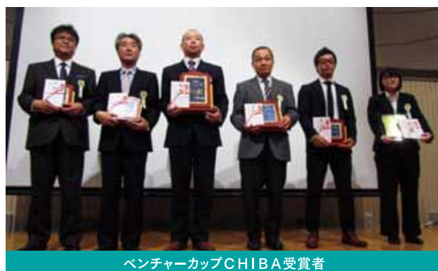
ベンチャーカップCHIBA受賞者