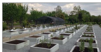
今年5月に改修した薬草園

詳細はホームページ http://www.fc.chiba-u.jp/hospital/top.htm をご覧ください。