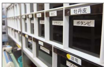
薬局（生薬を用いた漢方薬を処方）