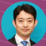
熊谷 俊人 千葉市長