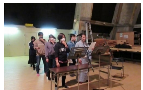
▲本番で使用する語りの録音風景