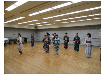
<昨年度の講座の様相>