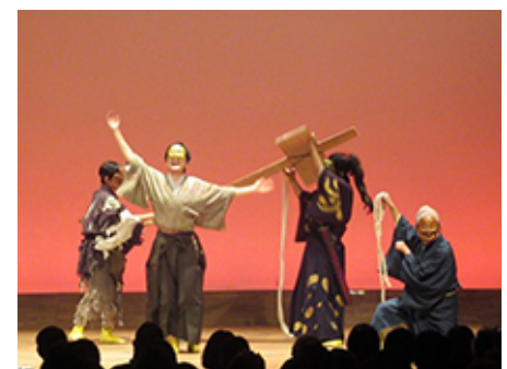
▲昨年の公演「里見八犬伝 其ノ参」