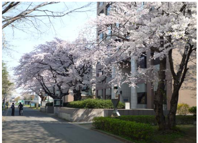
自然科学系総合研究棟