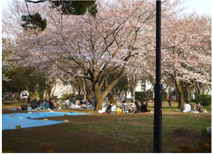
お花見する学生たち