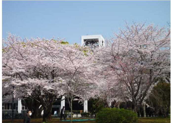
かたらいの森(図書館前)