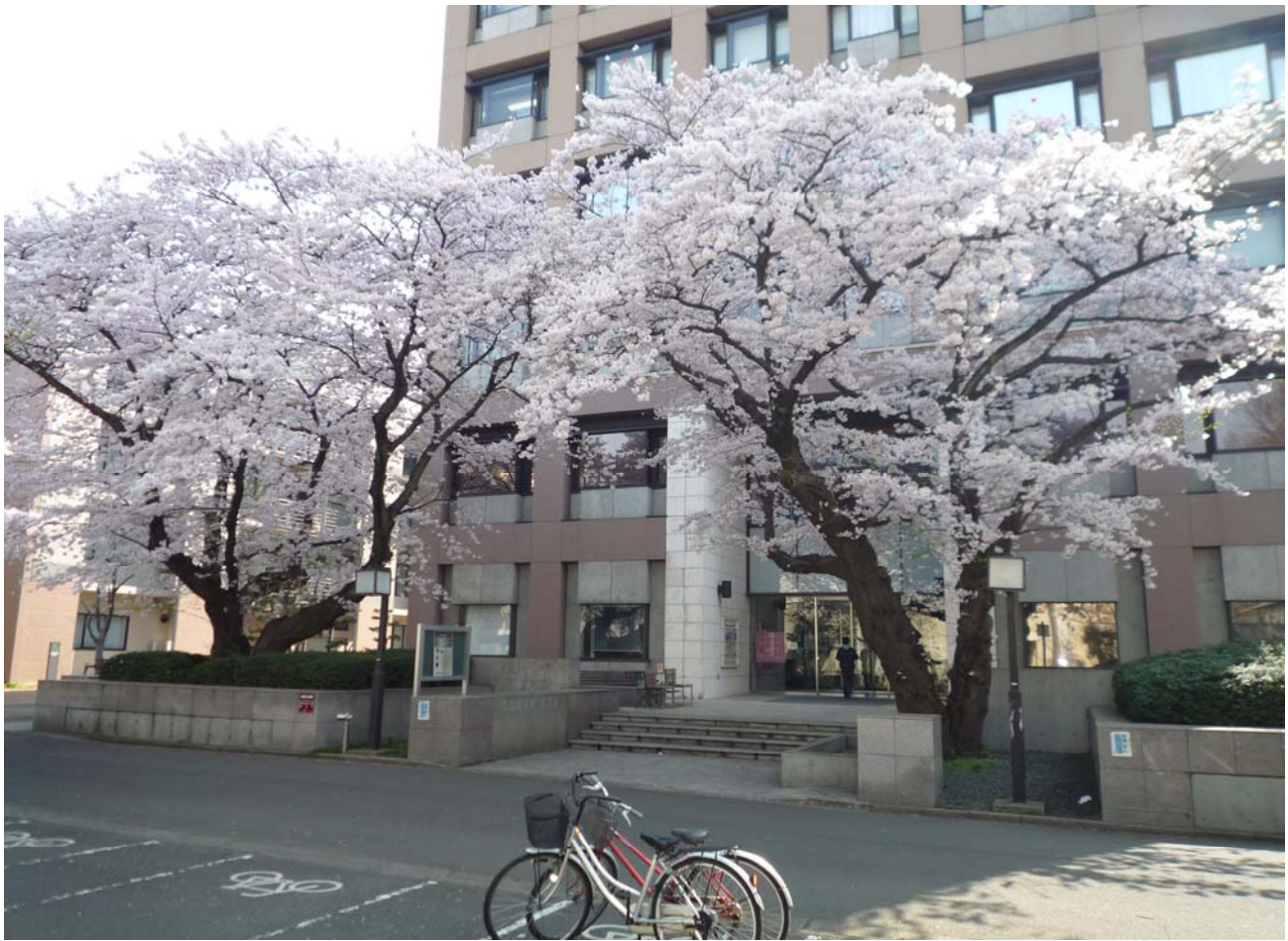
社会文化科学系総合研究棟