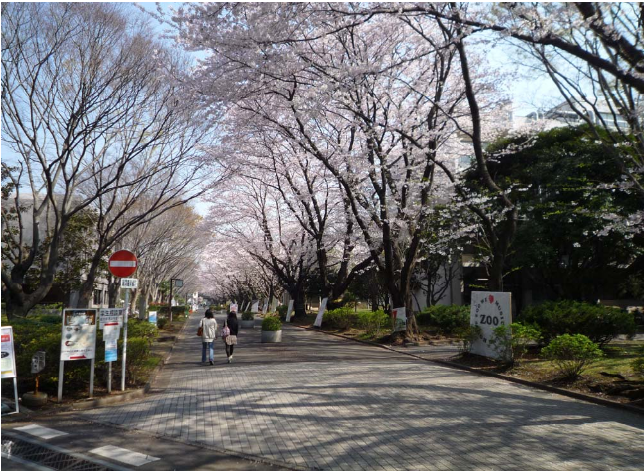
満開の桜並木が新入生を待っています