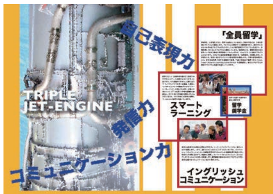
ENGINEプラン ENGINE Plan

現在進めている、ENGINE(Enhanced Network for Global Innovative Education)プランは、3つのプログラムによって構成されている。1番目の全員留学。2番目は英語の授業の抜本的な見直しによる履修単位数の倍増。3番目は、いつでもどこでも学べる、を実現するスマートラーニングである。一方で、大学院では、世界展開力強化事業で構築した様々なプログラムをマイナープログラムとして設置し、その中で研究留学を実現している。千葉大学はこれまで、12年間で10の世界展開力強化事業に採択されている。これは他の大学にはない特徴でもある。現在は、大学院における複数回の研究型留学の推進や、ライフサイエンス+データサイエンス+グローバル+デザインで、未来志向型の創造型人材を育成している。これらはENGINEプランのセカンドステージの大きな目標として推進している。