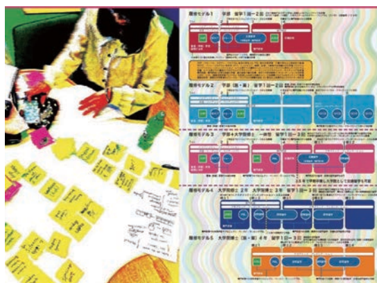
多様な履修モデル Diverse course models

The ENGINE (Enhanced Network for Global Innovative Education) Plan, which is currently underway, consists of three programs. First, all students must study abroad. Second, doubling the number of credits taken in English. And third, Smart Learning which enables students to study anytime, anywhere. In the graduate school, various programs have been set up as minor programs, and enable students to study abroad for research within these programs. Chiba University has been selected for the 10 INTER-UNIVERSITY EXCHANGE PROJECT over the past 12 years. This is a feature not found in other universities. Currently, Chiba University is promoting multiple research-based study abroad programs in graduate schools, and fostering future-oriented, creative human resources in Life Science + Data Science + Global + Design. These are being promoted as major goals of the Second Stage of the ENGINE Plan.