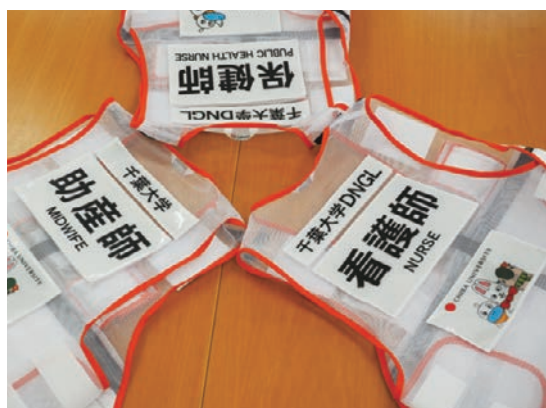
DNGL学生デザインによるビブス DNGL student-designed vests

In 2012, the “Disaster Nursing Global Leader Degree Program (DNGL)” was adopted by the Ministry of Education, Culture, Sports, Science, and Technology as a Program for Leading Graduate Schools. The Joint Disaster Nursing Program (a five-year doctoral program) was newly established in the Graduate School of Nursing as its operating body in 2014. This is a joint educational program consisting of five universities: Chiba University, University of Kochi, University of Hyogo, Tokyo Medical and Dental University, and Japanese Red Cross College of Nursing. After this joint disaster nursing major was closed, it was reorganized as a consortium course that expanded the number of participants to other majors in the five universities as a Disaster Nursing Minor Program in FY2021. This modification strengthens and complements the human resource development of each graduate school from the perspective of fostering global leaders in disaster nursing.