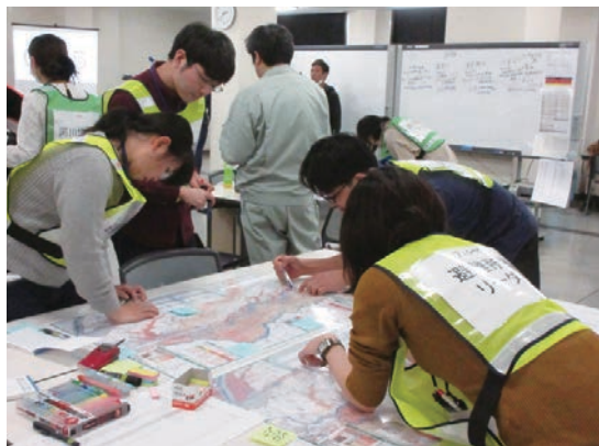
DNGLシミュレーション学習 Simulation learning in DNGL

The “Nurture of Creative Research Leaders in Immune System Regulation and Innovation Therapeutics” aims to foster leaders in the promotion of “therapeutics” specializing in intractable immune-related diseases (allergy, autoimmune diseases, cancer, etc.) by leveraging the strengths of Chiba University. The program was approved by MEXT in 2012, and has continued even after government support ended in FY2018. The program received an A-grade in the post-program evaluation of FY2018. By March 2023, the program had produced 60 graduates who are contributing actively both domestically and internationally.