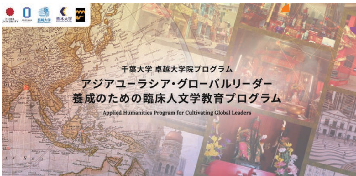
人文系卓越大学院プログラムHP Humanities WISE Program website

The “Applied Humanities Program for Cultivating Global Leaders” was the first and only program focusing on the humanities among the 30 adopted WISE programs. It was a program in collaboration with Chiba University, Okayama University, Kumamoto University, Nagasaki University, and The Graduate University for Advance Studies, Sôkendai (the National Museum of Japanese History). In addition, the program collaborated with private companies and overseas partner universities. With Digital Humanities and Asia-Eurasia Studies as its two focal points, the program aimed to raise intrinsic innovation in humanities, and to foster excellent doctoral human resource development.