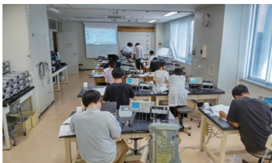
物理学実験授業 Physics experiment class scene

またこれに加え、理学部、医学部、薬学部、工学部、園芸学部、教育学部の学生が、学部・学科等で提供される学問分野独自の専門的教育を学ぶための基礎力を養うことを目的とし、「数学・統計学」、「物理学」、「化学」、「生物学」、「地学」の5分野で構成されている「共通専門基礎科目」を開講している。