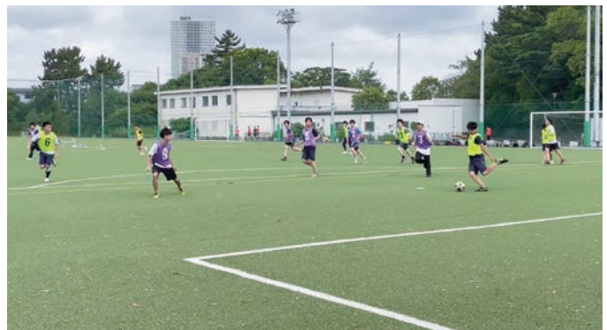
スポーツ・健康科目サッカー Courses for Sports and Health "Soccer"