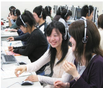
CALL授業 CALL class