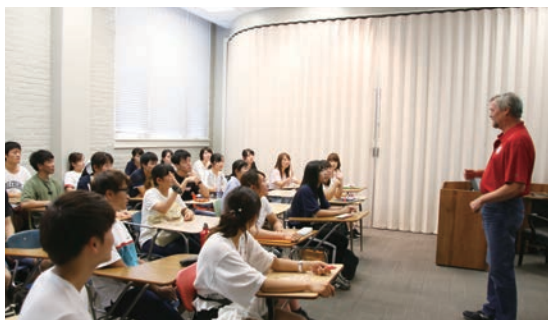
海外語学研修 Overseas language training

2020年度には、普遍教育を構成する科目のカテゴリーとして、「国際発展科目群」「地域発展科目群」「学術発展科目群」という3つの科目群を設定した。それぞれの科目群は以下の科目より構成されている。