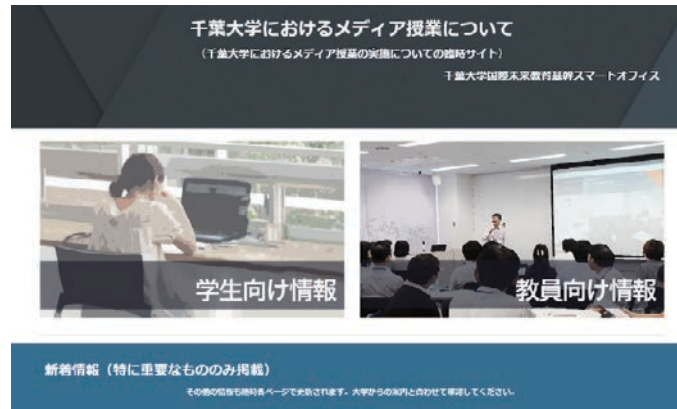
メディア授業の実施についての臨時サイト Temporary site for holding media classes

各部局および事務局各課では様々な学生支援・学修支援が実施され、学生相談室、就職支援課、附属図書館等においても各種サービスやコンテンツのオンライン化などの対応が取られた。また、全学的な支援事業として、総額3億円規模の千葉大学緊急学生支援パッケージが実施され、新型コロナウイルス感染症拡大に伴い経済的に困窮する学生に対して、重点的な支援が行われた。