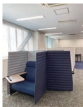
リサーチ・ハイズ(大学院生用居室) Research Hive (dedicated room for graduate students)

「科学技術社会論」、「環境科学」をそれぞれ学修しつつ、学生が自主的・自律的に研究計画を立案するセルフ・デザインド・メジャー(自己設計専攻)、3)時間・空間・学問領域の制約を超えた新たな創造の場を形成するスマートラーニングの実現、という3つの特徴を有している。