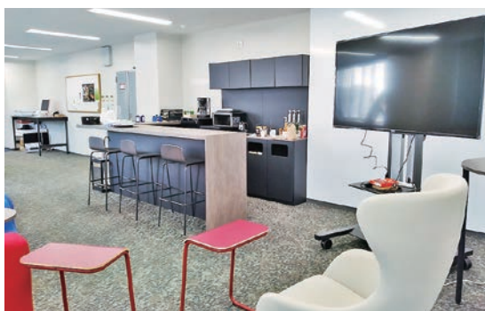
リサーチ・ハイズ Research Hive

date, we have produced many graduates who are active in overseas study.