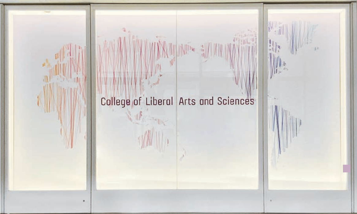
国際教養学部 College of Liberal Arts and Sciences

「科学技術社会論」、「環境科学」をそれぞれ学修しつつ、学生が自主的・自律的に研究計画を立案するセルフ・デザインド・メジャー(自己設計専攻)、3)時間・空間・学問領域の制約を超えた新たな創造の場を形成するスマートラーニングの実現、という3つの特徴を有している。