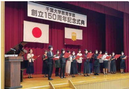
記念式典 Commemorative ceremony

教員養成のグローバル化プログラムにも数多く取り組んでおり、研究成果の一部は、2022年度科学技術分野の文部科学大臣表彰賞(理解増進部門)を受賞した。