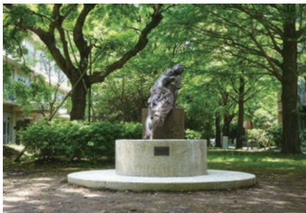
記念彫像 Commemorative statue

附属学校園として、幼稚園・小学校・中学校が教育学部と同じ敷地内にあり、特別支援学校も千葉市内にある。恵まれた立地条件により、学部—附属学校園間の連携研究が盛んに行わ