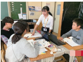
教育学部教育実習 Faculty of Education teaching practice

学部編と同窓会編の2冊を一緒に飾り箱に収めた記念誌の発行、記念彫像「流れる雲」(親子像:同窓会員廣川政和制作)の建立、教育学部150年の歩み(年表)と研究成果を紹介した壁面ギャラリーの設置、教育学部の歌「小さな大人大きな子ども」(谷川俊太郎作詞・山本純ノ介作曲)の制作、記念行事(記念式典と記念コンサートの二部構成 2022年10月22日)の挙行、そして現在も、今後10年計画で進める教員養成支援事業を継続中である。