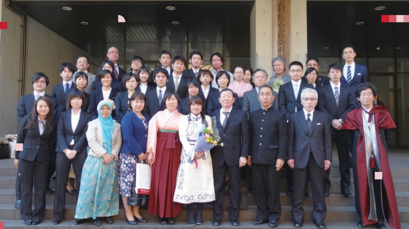
2013年度博士前期課程の修了生 Students graduating from GSHSS's master's course in Academic Year 2013

人文社会科学研究科を教育組織として改組することで、人文公共学府が発足した。この改組に際しては、学際的な教育をさらに発展させることを狙ってカリキュラム改革も行い、共通基礎科目として、各分野に共通する研究方法や研究倫理を教授する科目に加えて、留学、学会報告、各種調査、就労体験などの実践的な学びを促進するため、フィールドワークやインターンシップの科目を設け、今日に至っている。