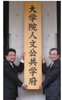
人文公共学府看板の披露式典 Ceremony for displaying GSHSPA signboard

When Chiba University began offering graduate education in humanities and social sciences in 1985, only master's courses in literature and social sciences were available for humanities and social sciences, respectively. Thereafter, in 1995, the Graduate School of Social Sciences and Cultures (GSSSC), which only had a doctoral course covering humanities and social sciences, was established to conduct interdisciplinary graduate education. In 2006, in reorganizing GSSSC into the Graduate School of Humanities and Social Sciences (GSHSS), the university integrated the GSSSC's master's courses