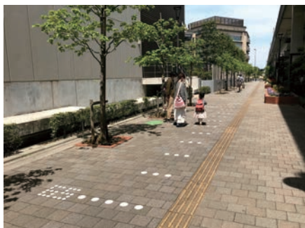
街づくり整備の取り組み(千葉県柏市) Town planning project (Kashiwa City, Chiba Pref.)

2010年度に始まった、環境省による「子どもの健康と環境に関する全国調査(エコチル調査)」に、本センターは15の地域(ユニット)センターの1つとして参加し、千葉県内の母子約6,000組を対象に、子どもの胎児期から40歳になるまでを追跡し、環境要因と健康との関係を明らかにする研究を進めている。2014年からは、出生コホート「こども調査」を開始し、約1,000組の母子を対象に栄養や生活習慣、遺伝子と子どもの健康状態との関連を15歳になるまで追跡・解析している。この様に、胎児期からの予防医学の確立を目指している。