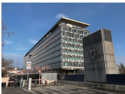
スイス・ジュネーブのWHO本部 WHO HQ in Geneva, Switzerland

本センターは、「ゼロ次予防による健康な社会づくり」研究および教育を強力に推進していく。