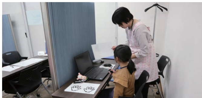
発達調査 Child development study

A Japan Environment and Children’s Study by the Ministry of the Environment was launched in 2010 to try to clarify the relationship between environmental factors and children’s health, and the CPMS was selected as one of the 15 regional centers for the project. This is a long-term, large-scale cohort study, in which approximately 6,000 mother and child pairs in Chiba Prefecture were recruited, and the children followed until they reach the age of 40. In addition, the Chiba Study of Mother and Child Health, a cohort study involving approximately 1,000 mother and child pairs, was launched in 2014, focusing on the relationship between nutrients, lifestyle, genes, and health. In this cohort study, children will be followed until they reach the