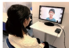
社交不安症の視線トレーニング装 置(ECOM) Eye COMmunication trainer (ECOM)