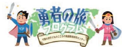
不安の対処法を学ぶ「勇者の旅」プログラム “Journey of the Brave”, program: a solution for children's anxiety