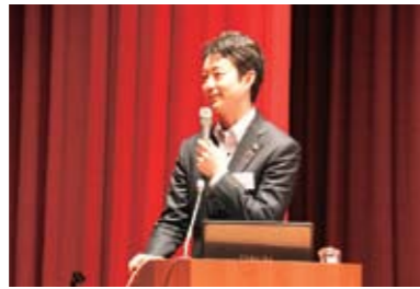
千葉市長 熊谷俊人氏にご講演いただきました