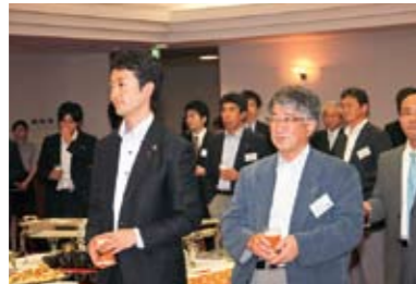
懇親会の様子 左から熊谷市長、犬養会長