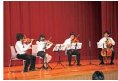
“千葉大学管弦楽団”による弦楽四重奏