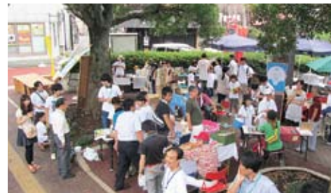
西千葉子ども起業塾の様子