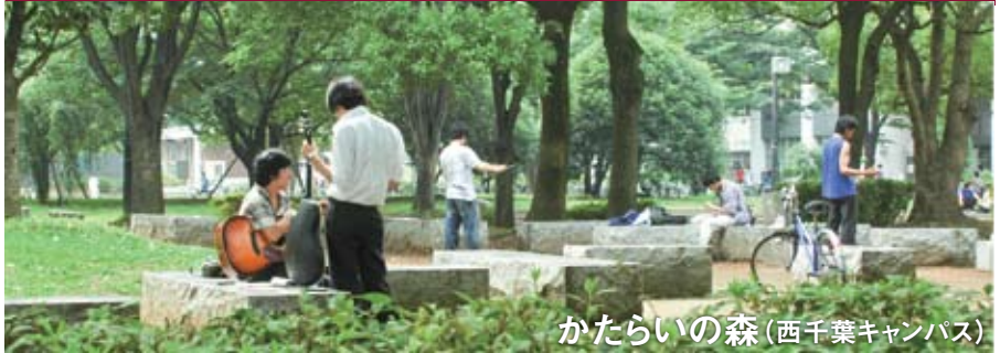
かたらいの森(西千葉キャンパス)

本倶楽部は、産業経済界並びにその関連分野において活躍する千葉大学校友「千葉大学（前身を含む）を卒業した者」自らが、相互の啓発、相互の援助並びに親睦を図り、もって母校及び産業経済界の発展に寄与することを目的として、平成21年6月11日に設立総会を開催し設置されたものです。