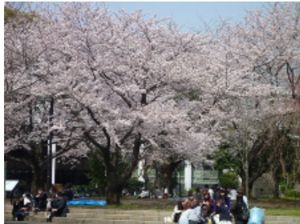
かたらいの森（図書館前）