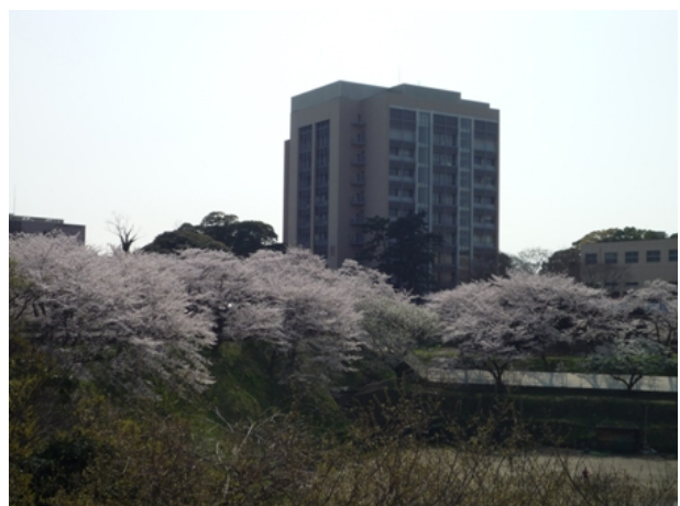
薬学部研究棟を望む桜