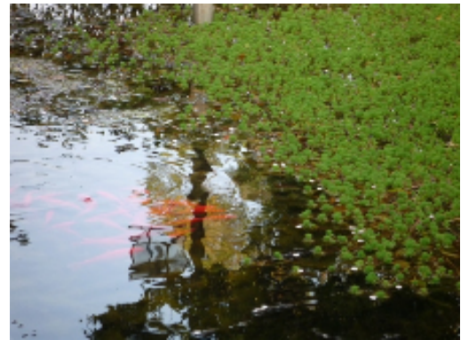
けやき会館隣の池 金魚も活発に動きだしました。