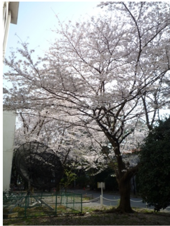
環境リモートセンシング研究センター 大きなパラボラアンテナが衛星から電波を受信しています。