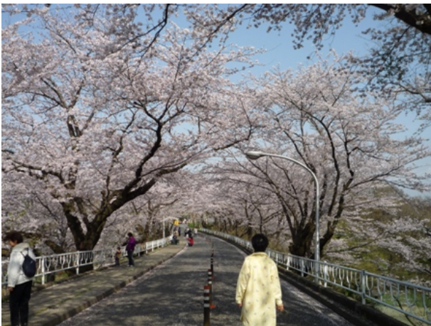
医学部から千葉大附属病院に続く連絡道路