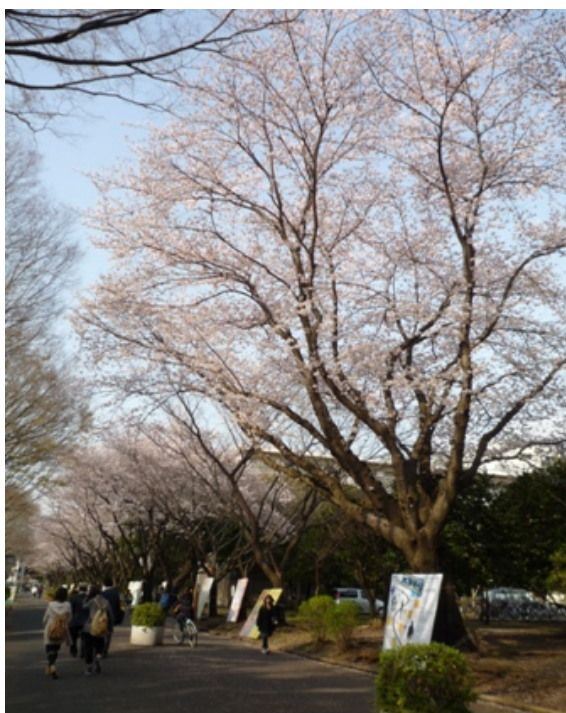
千葉大メインストリートの 満開の桜