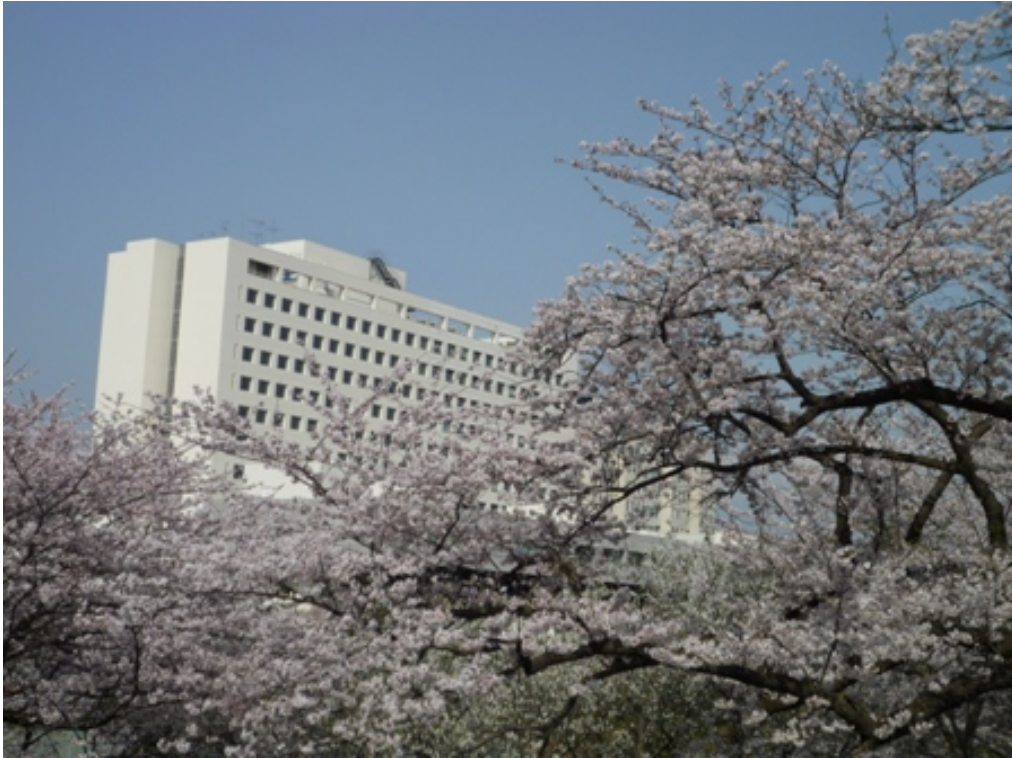
千葉大附属病院を望む桜