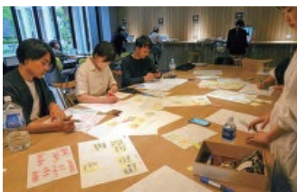
起業ワークショップの様子

スタートアップ創出支援、アントレプレナーシップ教育のより一層の強化のために令和5