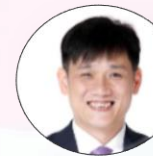
ハノイ医科大学 看護学部副学部長 チャン・スオン・ クワン教授