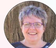
フリーステート大 学健康科学部 ロニエル・ジャン セン教授