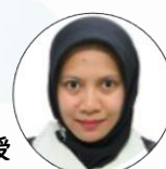
ガジャマダ大学公 衆衛生看護学部 ウキ・ノビアナ 教授