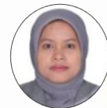
ガジャマダ大学 IPEプログラム統括 部長 スリ・ムリヤニ教授