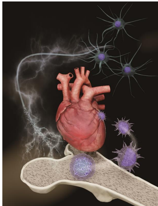
心不全の再発に血液へのストレスの蓄積が関与