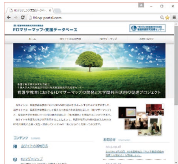
図4：FD プランニング支援データベース