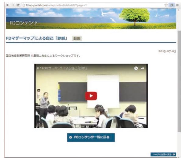
図3：FD コンテンツ（例）FD マザーマップによる自己「診断」