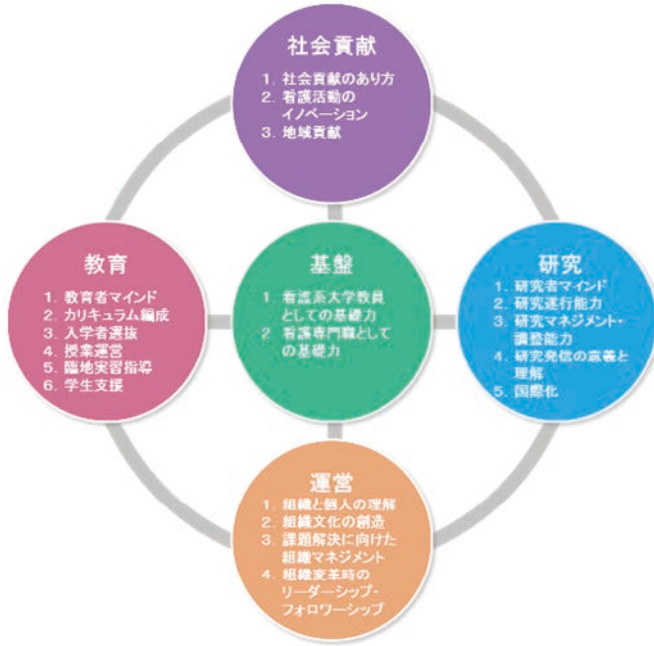
図1：FD マザーマップの開発全体構成