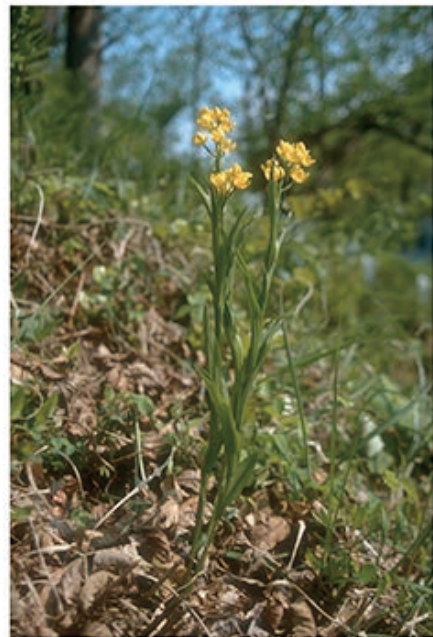
部分的菌従属栄養植物のキンラン

ほとんどの植物は地下部において菌類と共生し、菌根を形成しています。通常の菌根共生では植物から菌根菌に光合成産物である炭素化合物が供給されますが、菌根菌から炭素化合物を受容する植物も知られ、このような植物は菌従属栄養植物と呼ばれています。菌従属栄養植物は様々な植物分類群の中にみられ、それぞれ独立して進化したと考えられており、生物進化の自在性を考える上でもたいへん興味深い対象です。様々な菌従属栄養植物を対象として、分子生物学的手法を用いた菌根菌の同定、安定同位体分析による物質動態の解明などを行い、菌根共生系の解明を目指しています。これまでに、ラン科植物のキンラン・菌根菌・樹木の三者共生の関係、タシロランと腐生菌（ナヨタケ科の菌類）の共生関係、ホンゴウソウ科のホンゴウソウ、ウエマツソウおよびサクライソウ科のサクライソウと特定のアーバスキュラー菌根菌との間の菌根共生などについて明らかにしてきました。また、近年は他大学との共同研究でこのような植物の菌根共生における遺伝子発現についても研究範囲を広げ、共生メカニズムの解明にも取り組んでいます。