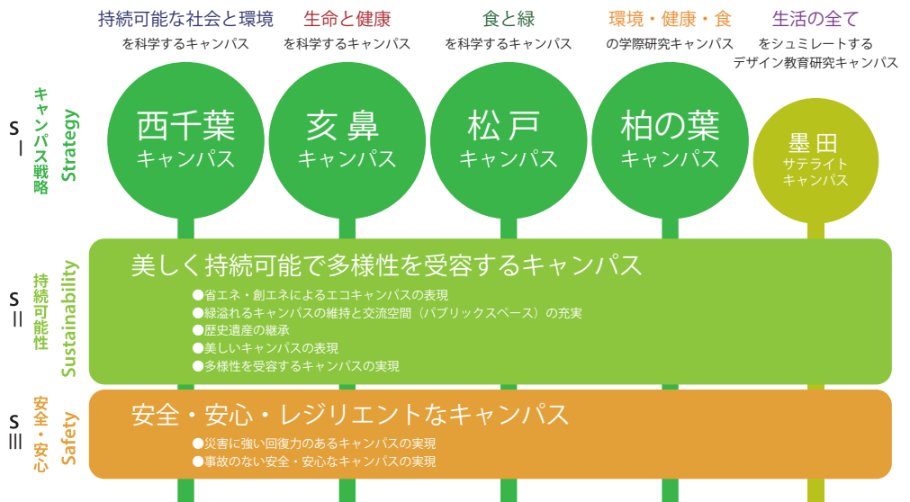
キャンパスマスタープラン基本整備方針の特長と構成